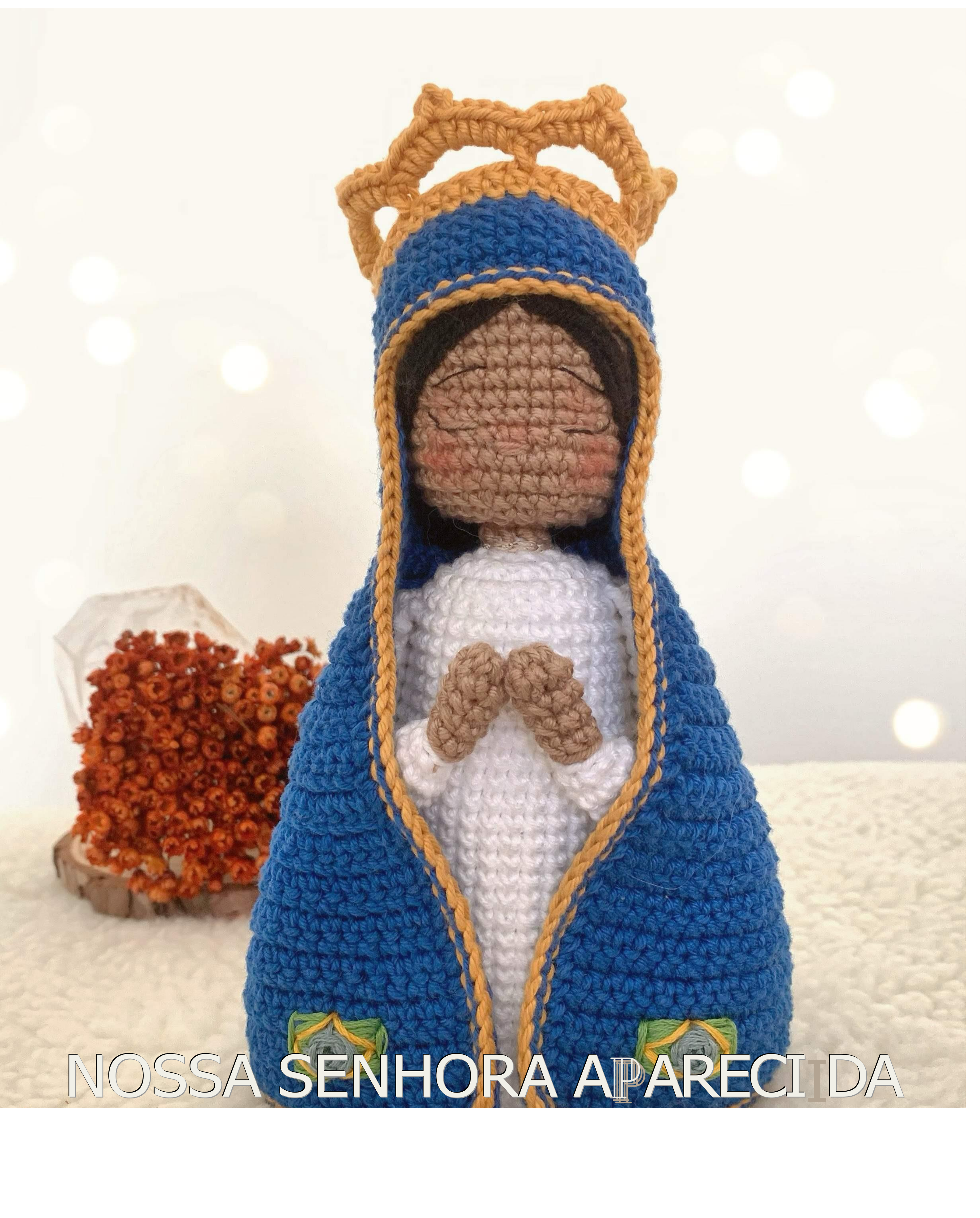
NOSSA SENHORA APARECIDA